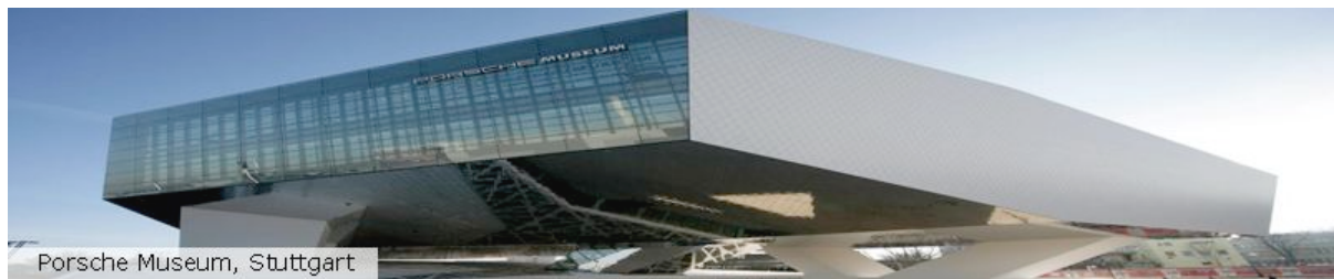
Porsche Museum, Stuttgart